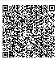
คู่มือการใช้งาน Pre-Register