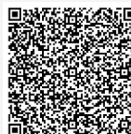
คู่มือการใช้งาน E Voting